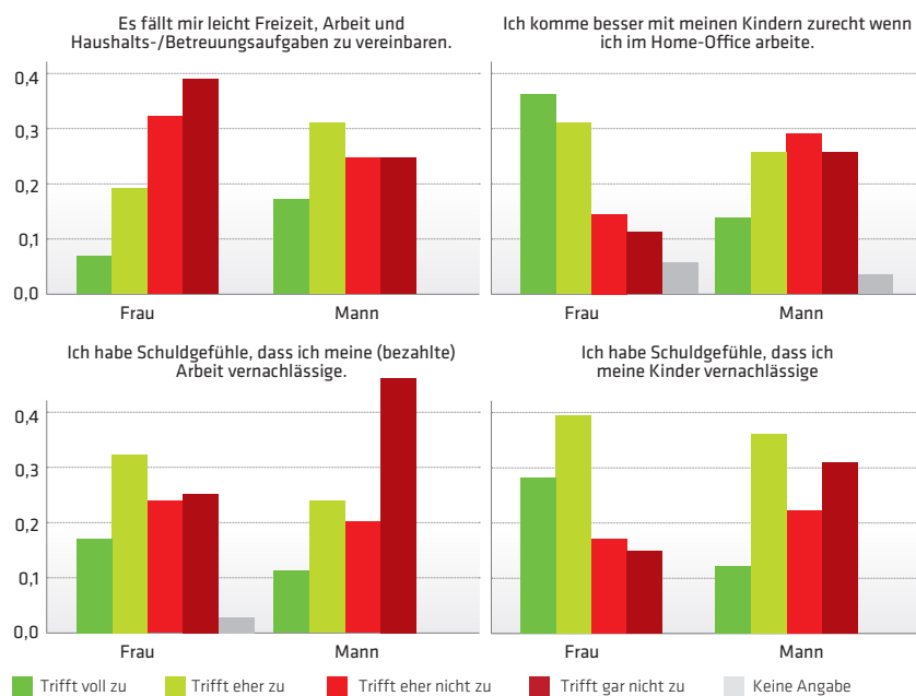
Abbildung 3: Zustimmung zu den Statements zum Thema „Vereinbarkeit von Familie und Beruf im Home-Office“ nach Geschlecht

Anmerkung: Diese Frage wurde nur an Personen mit Kindern unter 15 Jahren gestellt, welche während der Ausgangsbeschränkungen (zumindest teilweise) von zu Hause gearbeitet haben.