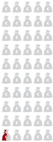
0 - 20 % ÄRMSTES FÜNFTEL