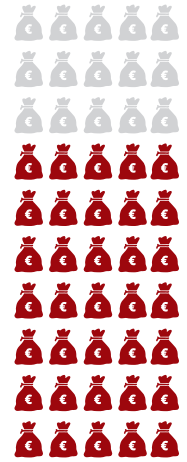
80 - 100 % REICHSTES FÜNFTEL